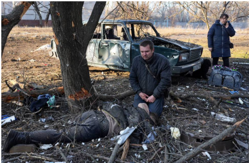
Familia rusa devastada en Varónezh tras ver a su hijo fallecido a causa del bombardeo.

"La decisión ha sido unánime por parte de todos los reunidos. Estaba claro que no podíamos quedarnos de brazos cruzados ante la situación de Ucrania" - Joe Biden, en su discurso del 4 de abril.