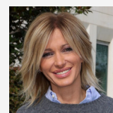
Susana Griso, periodista de Antena 3

"Con los recientes bombardeos, creo que el conflicto puede desencadenar algo mucho peor y que nos va a afectar directamente a nosotros, ciudadanos españoles. La guerra va a comenzar a expandirse por Europa, y más tarde, por todo el mundo. Muchos jóvenes tendrán que alistarse en el ejército sin saber siquiera cómo empuñar un arma debido a la ley marcial, en efecto."